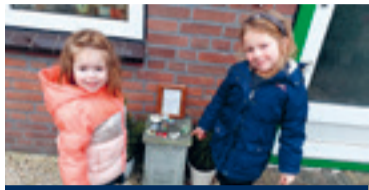
03 Happy stones uit Maasdijs