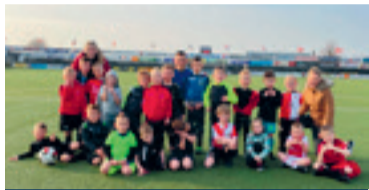
07 Mini voetbal bij VV Maasdijs