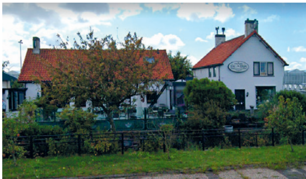
Eetcafé "De Dijk" had in 1835 de naam "Rust Wat" en zo'n 100 jaar later gaf Felix de Groot het de naam "Café Rust Wat".

Bas antwoordde: "Dat de machine niet te breed is, anders kan hij niet over alle dammen en bruggen."