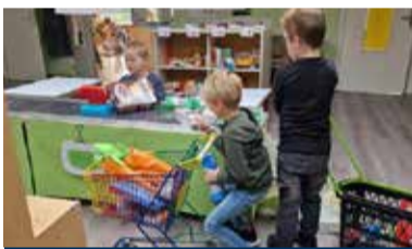
08 De Maasbever Kidscorner