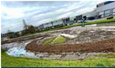
05 Stchting Groener Maasdijs: Natte Nol

Nummer 11 december 2023 34 e jaargang www.maasbever.nl