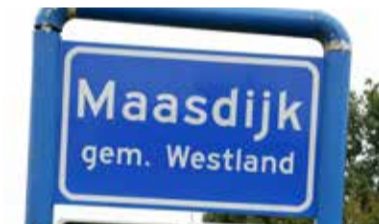
11 Maasdijs 2040 toekomstvisie