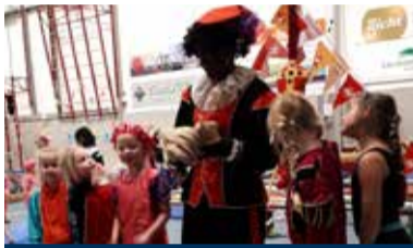
07 Pietengym bij KDO Maasdijs