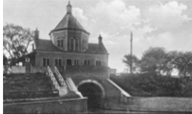
03 Open Monumentendag 9 en 10 september 2023

Nummer 07 augustus 2023 34 e jaargang www.maasbever.nl