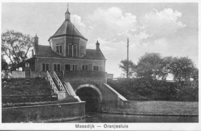
Maasdijk — Oranjesluis

Ook Maasdijk levert een bijdrage aan het programma, dit jaar voor het eerst met twee monumenten, namelijk de Oranjesluis en de Dorpskerk.