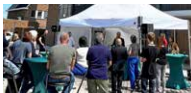
05 Realisatie huurwoningen 'Wonen Rond de Toren' feestelijk gevierd