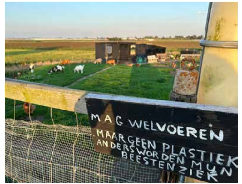
De geitjes voeren is leuk, maar geen plastic alsjeblieft dankjewel! ❤️ 🐐🐐 #Polder #Maasdijk #Spuidijkje