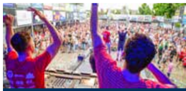
09 Het 36ste Zomerspektakel was om nooit te vergeten!