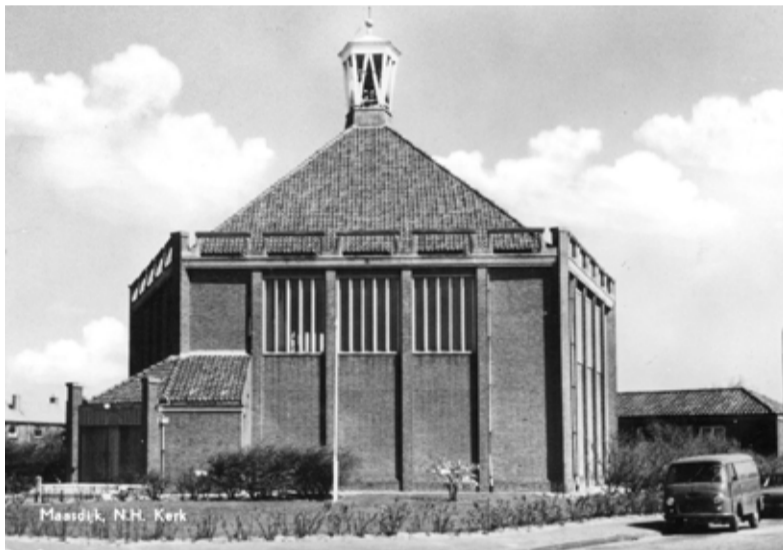
Maasdijk, N.H. Kerk

Secretariaat: J.O. Voogt, Email: jvomsd@caiw.nl