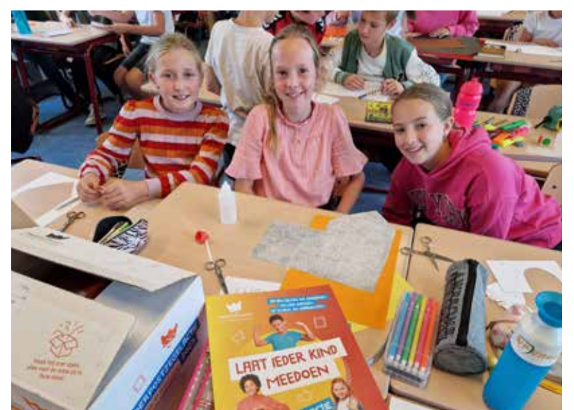
Binnenkort start groep 7 met de verkoop van kinderpostzegels