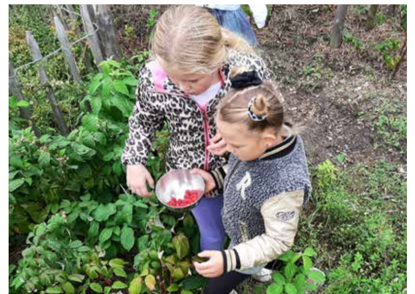
Groep 4 smult van vers fruit uit het Tiny Forest. Wat een feest!