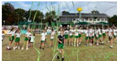
07 Geslaagde openingsdag 60 jaar Dijkvogels!