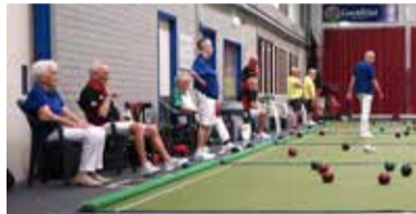
05 Greenpack Pairs toernooi IBC Maasdijs