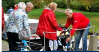
03 Een heerlijke vaartocht door het Westland

Nummer 08 september 2023 34 e jaargang www.maasbever.nl