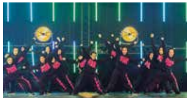
03 Westlandse dansschool Dance For You Nederlands Kampioen

Nummer 05 mei 2023 34 e jaargang www.maasbever.nl