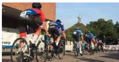
03 Wielerspektakel barst weer los woensdag 28 juni a.s.