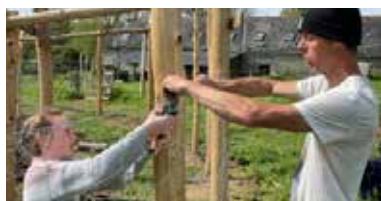
05 Groener Maasdijs gaat verder