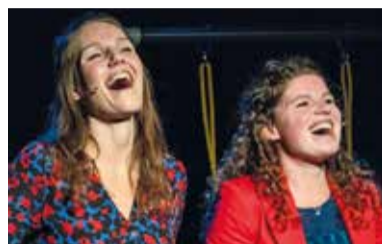
03 Hoe gastvrij zijn de bewoners van Maasdijs?

Nummer 3 maart 2024 35 e jaargang www.maasbever.nl