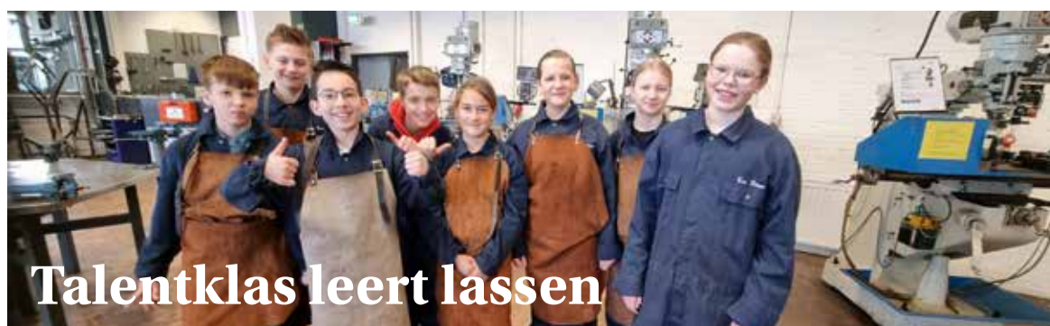
Talentklas leert lassen

maken. Daarna gingen we toveren met kleuren. Als je basiskleuren mengt, ontstaan er allemaal nieuwe kleuren! De kinderen mochten hierna zelf in het verfschort van een kunstenaar kruipen en zoveel mogelijk verschillende kleuren mengen. Na het werken in het atelier gingen we op onderzoek uit in het museum. We werden allemaal kleurenhelden met onze kleurencape en hebben onze kleur gezocht in de kunstwerken van het museum!