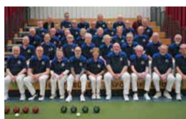
07 Indoor bowls club viert 25-jarig jubileum