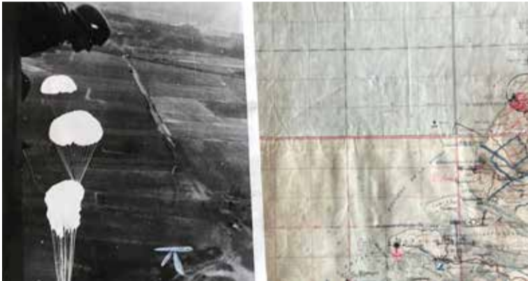
Foto van oude stafkaart van de Luftwaffe en persfoto's van de Fallschirmjagers van de Meidagen 1940 in Nederland. Deze en nog veel meer uniek items zullen in Mei te zien zijn.