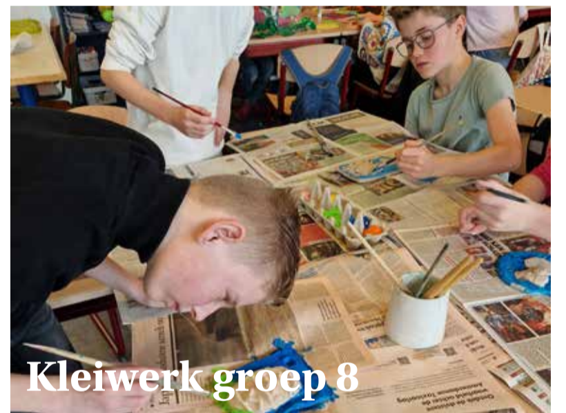
Kleiwerk groep 8