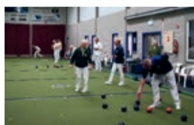
11 IBC Maasdijs in het teken van het 25 jarig bestaan!