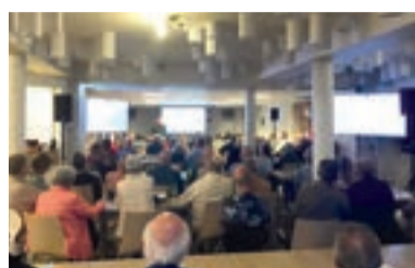
03 Lezing over Blankenburg-verbinding in Maasdijs groot succes

Nummer 4 april 2024 35 e jaargang www.maasbever.nl