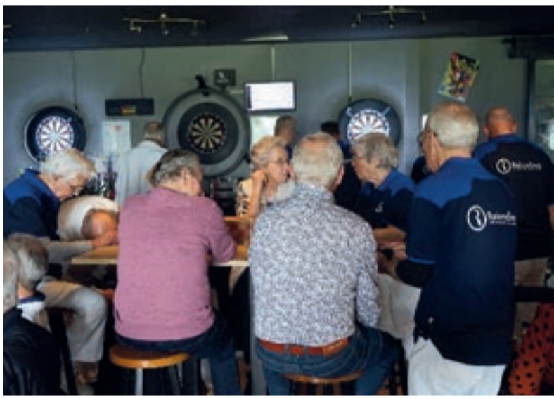
Na afloop nog even gezellig napraten...

Zaterdag 13 april jl. werd het Looye Jubileum toernooi gehouden in Sporthal Maasdijk? Er deden niet minder dan 28 teams mee. De gasten kwamen o.a. uit Eemnes, Schiedam,